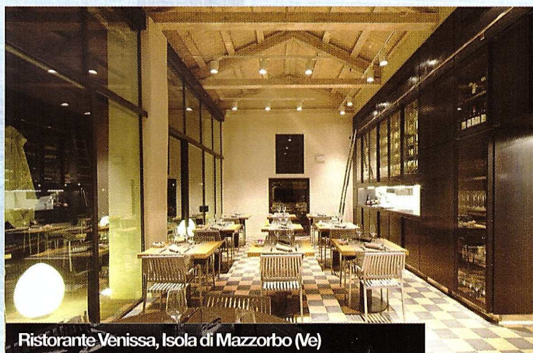
Ristorante Venissa, Isola di Mazzorbo (Ve)

Una struttura ricettiva, dedicata al turismo naturalistico e nautico lagunare, che offre pernottamento nell'ex casa padronale e una ristorazione d'eccellenza incentrata sulle tipicità locali. Al tempo stesso, centro di formazione, educazione e ricerca agro-ambientale che si propone di recuperare parte dell'area agricola con vigneto, frutteto e orti e di realizzare un vero e proprio centro didattico, oltre che promuovere le relazioni imprenditoriali tra agricoltori coinvolgendo esperti del settore e potenziali investitori. Entrando nel ristorante Venissa si resta affascinati dalla grandiosa parete a vista, interamente in acciaio e vetro, che contiene centinaia di preziose bottiglie sistemate in ordine perfetto e mantenu-