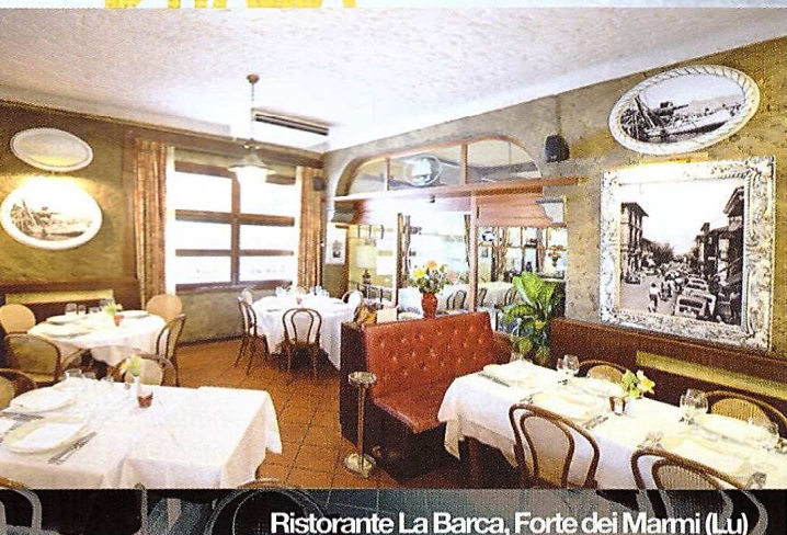
Ristorante La Barca, Forte dei Marmi (LU)